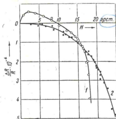
Рис. 2. 1 — \Delta R_{\parallel} / R , 2 — \Delta R_{\perp} / R

3. Измерение влияния магнитного поля на электропроводность сульфидов хрома показало, что \Delta R/R для составов 50, 53, 54, 55, 56 ат. % S имеет чрезвычайно малое значение, выходящее за пределы чувствительности нашей установки. Исключением являются сульфиды хрома с избытком серы (58—59 ат. %), для которых удается измерить изменение сопротивления в магнитном поле, но \Delta R/R имеет отрицательный знак, т. е. является аномальным (см. рис. 2).